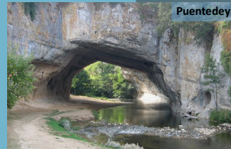
Puente de Dios

¡No te acerques demasiado a este pozo, o el Diablo pensará que quieres visitarlo! Mejor admira la cascada de La Mea, con sus más de 30 m de caída, y relájate con el sonido del agua. No olvides acercarte a ver el "puente de Dios", Puente de Dios, un arco natural de roca sobre el río Nela que no deja indiferente a nadie.