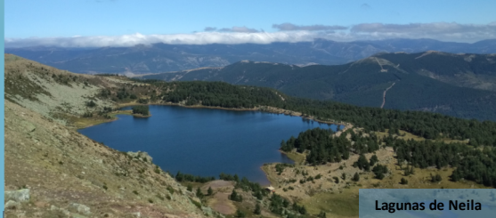
Lagunas de Neila