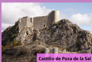
Castillo de Poza de la Sal