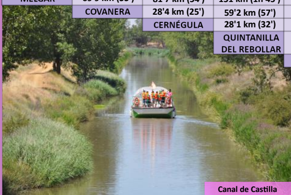
Canal de Castilla