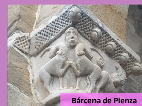
Bárcena de Pienza