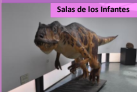
Salas de los Infantes