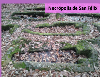
Necrópolis de San Félix