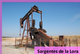
Sargentos de la Lora