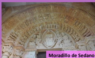
Moradillo de Sedano

Los alrededores del Pozo Azul son ideales para hacer senderismo, ya que los paisajes son espectaculares. Viaja a la Edad Media con el románico de Sedano y aprende cómo extraían petróleo en Sargentos de La Lora.