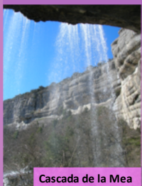
Cascada de la Mea

Puedes visitar la Casa del Parque de Ojo Guareña, ver la Cueva Palomera, la Ermita de San Bernabé y aprender sobre el complejo kárstico. En la zona puedes volver al s.X gracias a la necrópolis de San Félix, en Villabáscones, con más de 25 tumbas excavadas en la roca. Para aprender sobre la historia y costumbres de la zona entra al Museo de la Merindad de Sotoscueva, justo al lado y de visita gratuita. Para hacer una buena foto visita la cascada de La Mea en Quintanilla del Rebollar.