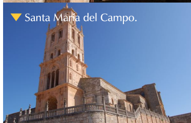
▼ Santa María del Campo.