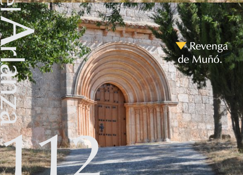
▼ Revenga de Muñó.