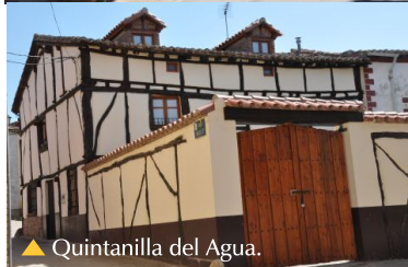
▼ Quintanilla del Agua.