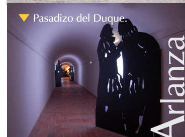
▼ Pasadizo del Duque.