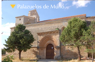
▼ Palazuelos de Muñó.