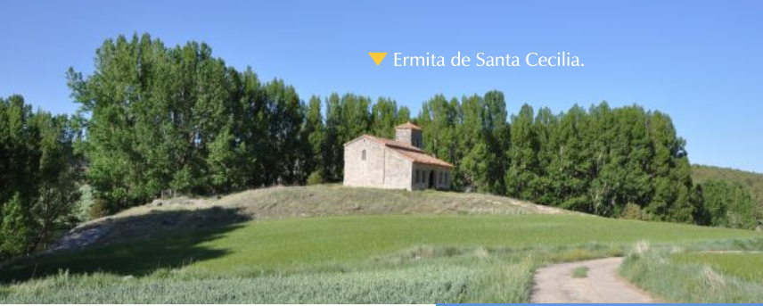
▼ Ermita de Santa Cecilia.

En el ascenso de Santibañez del Val al bello núcleo rural de Barriosuso , enclavado en la Sierra de Cervera, se alza, aislada en una loma, la Ermita mozárabe de Santa Cecilia .