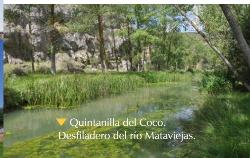
▼ Quintanilla del Coco. Desfiladero del río Mataviejas.