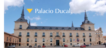
▼ Palacio Ducal.

En la misma plaza se levanta el Convento de Santa Clara , que resalta por su iglesia de corte clasicista.