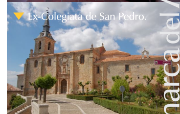
▼ Ex-Colegiata de San Pedro.