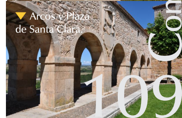
▼ Arcos y Plaza de Santa Clara.