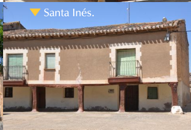
▼ Santa Inés.