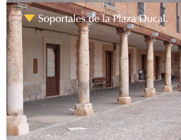
▼ Soportales de la Plaza Ducal.