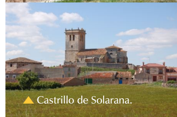
▲ Castrillo de Solarana.