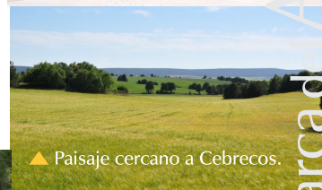
▲ Paisaje cercano a Cebrecos.